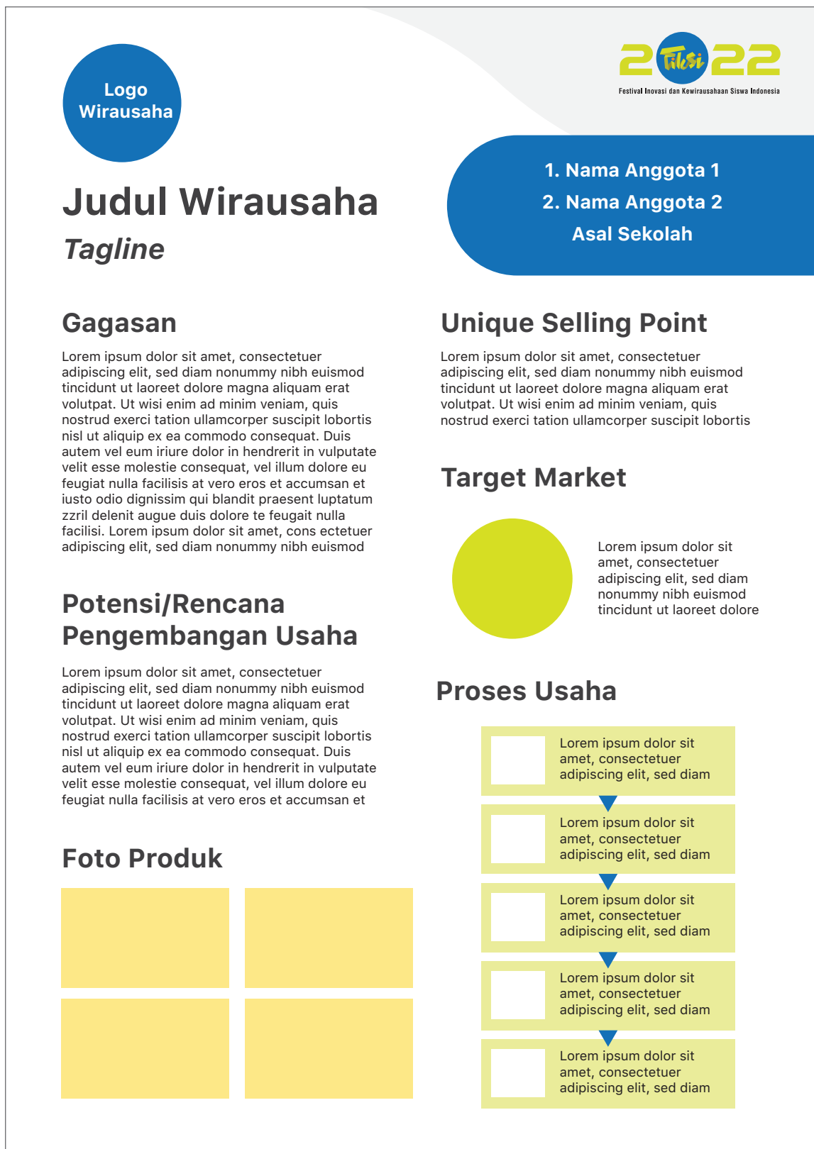
Contoh Layout Poster